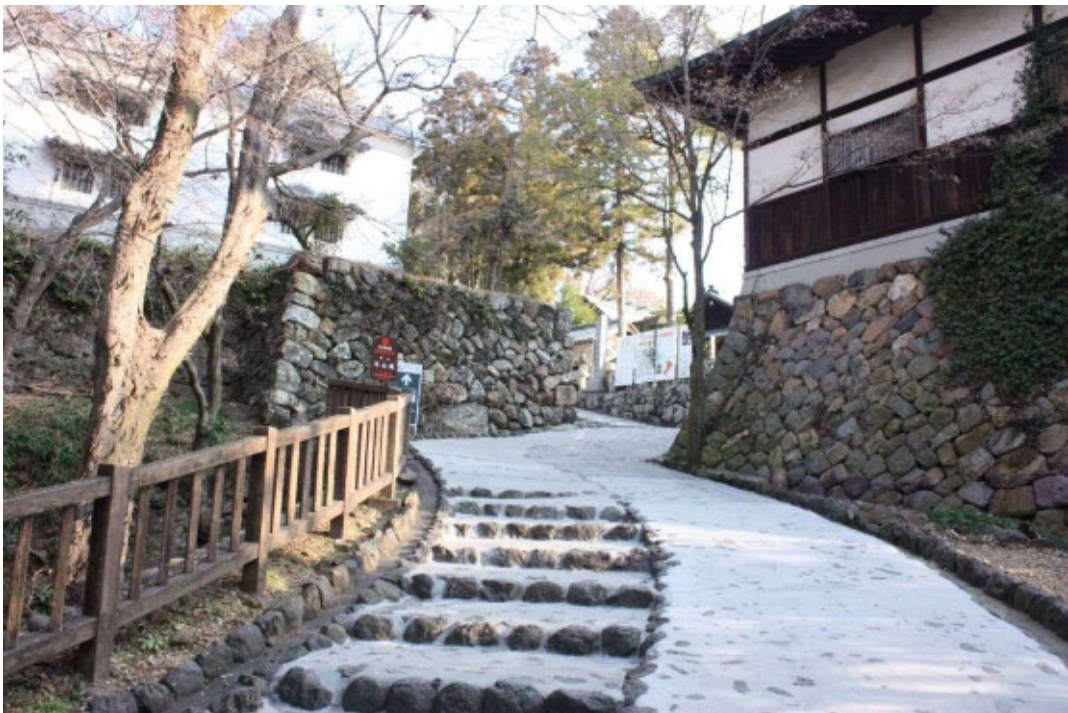
石垣及び櫓形跡