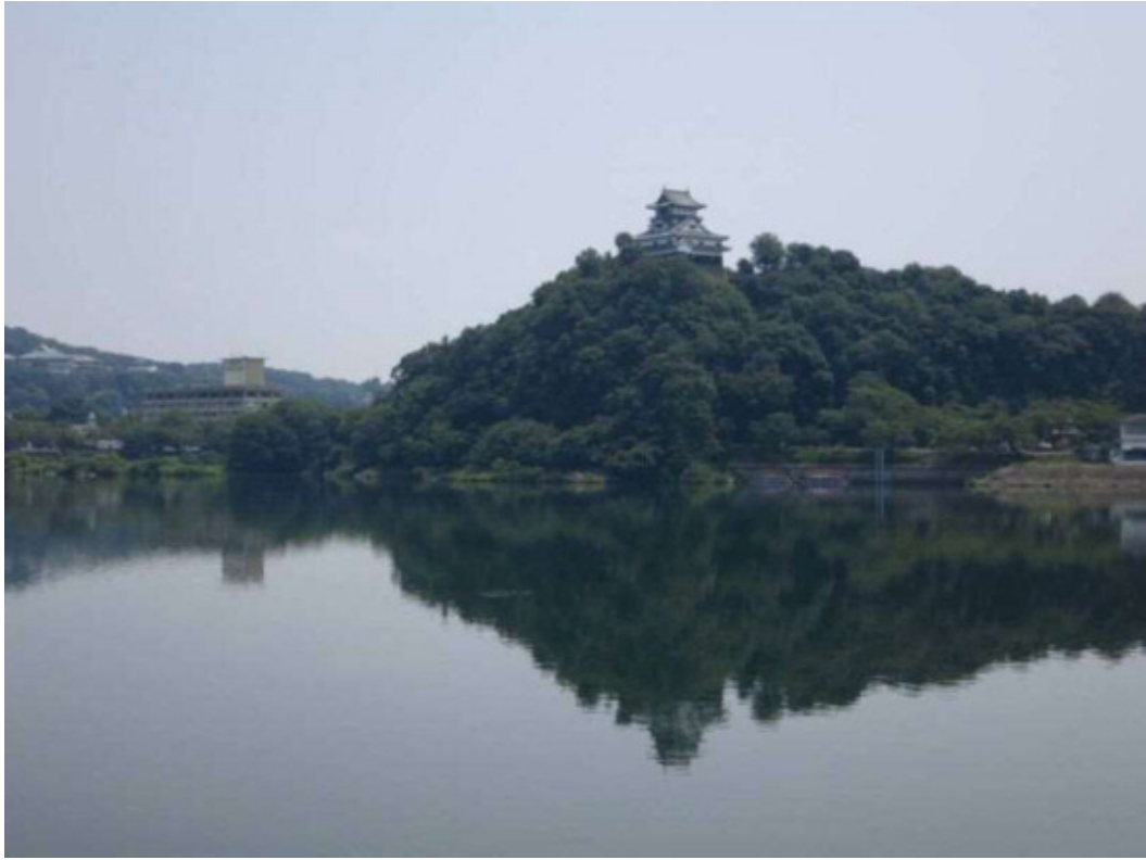
全景写真 木曾川対岸から