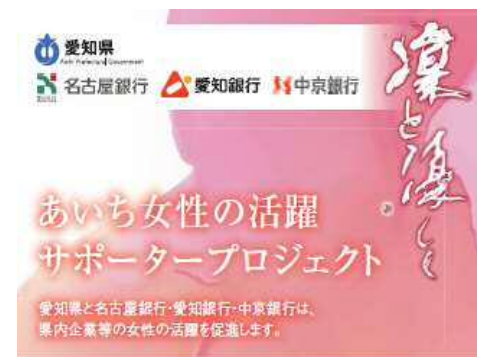
<ポケットティッシュイメージ>