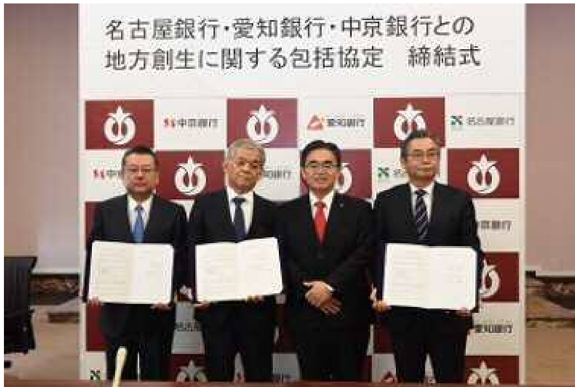
〈地方創生に関する包括協定 締結式〉