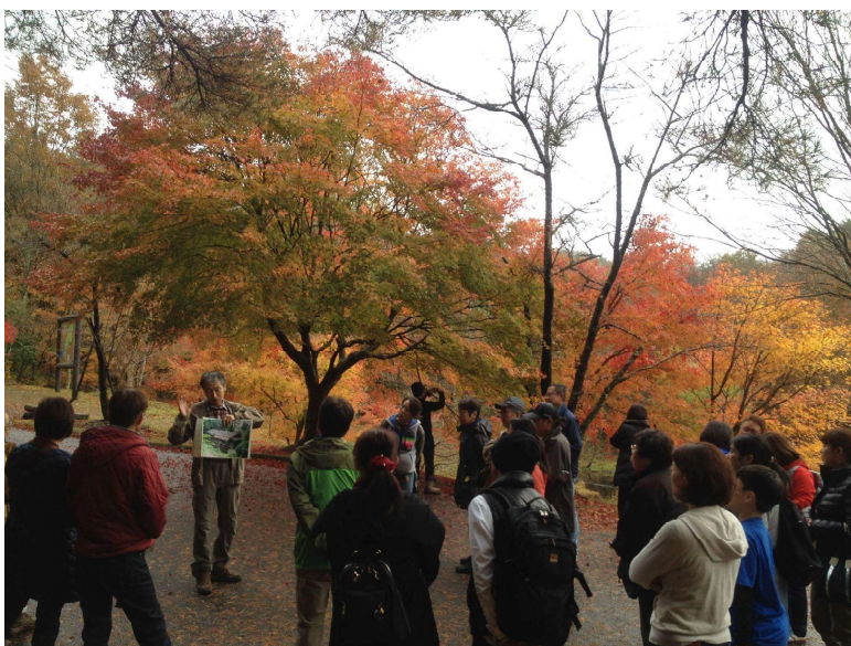
秋の愛知高原・奥三河体験の旅（平成28年11月19日）