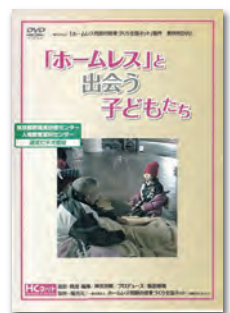
(30分/45分) (2009年) ガイドブック付き

「ホームレス」の存在を知った子どもたちが抱く疑問に、真正面から答える教材用DVDです。「ホームレス」への偏見・差別をなくし、全国で多発する子どもたちによる「ホームレス襲撃・いじめ」という「最悪の出会い」を、希望ある「人と人としての出会い」へと転換していくために、全国の学校でこの映像を使った授業が取り組まれることを切に願います。