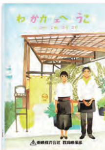
(35分) (2016年) 字幕あり/活用の手引付き