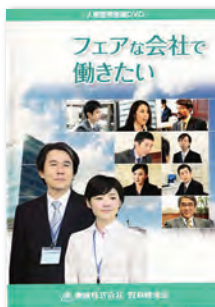
(25分) (2015年) 字幕あり

このDVDは、人事部の新入社員の体験をドラマにして、公正な採用選考をはじめとする企業における人権のあり方について学ぶ教材として制作しました。