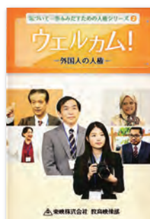
(16分) (2016年) 字幕あり

日本で暮らし働く外国人が増えています。外国人と働くには、多様性を尊重し、その文化を受け入れると同時に、日本の文化や習慣も尊重してもらうことが必要です。この作品は、企業の広報担当者を主人公に、異文化の壁をむしろ扉としてとらえ、開いていくことを描いた教材です。