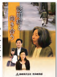
(30分) (2016年) 字幕あり

このDVDは、認知症によくみられる症状、認知症の人の思いと家族の気持ちの変化、症状の理解、介護者の交流の大切さなどを描いたドラマ教材です。