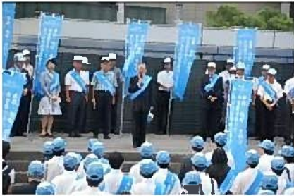
出発式知事のあいさつ