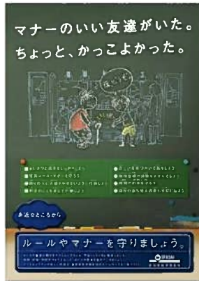
ポスター（小中学生用）

市町村、市町村教育委員会、幼稚園・保育所、小中学校、県立学校、私立学校、県庁各課など