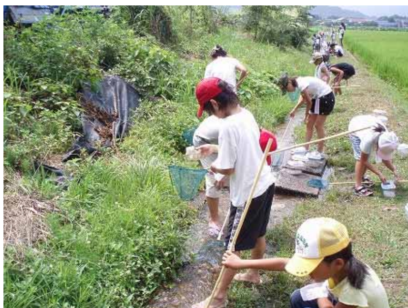
農業への理解促進

農村生活アドバイザー、農村輝きネット会員等の女性農業者が農業体験を子供達に伝えるために活躍できる場づくりや食農教育に参画できるように支援します。