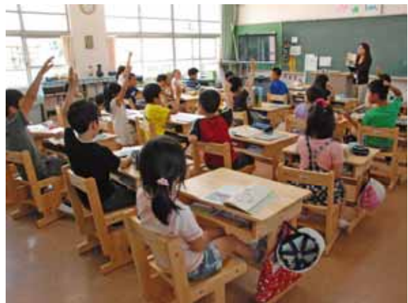
県産材利用の机と椅子の導入