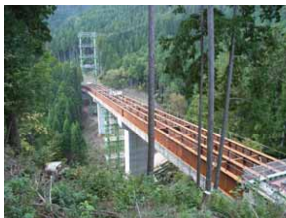
急ピッチで進む広域農道の橋梁工事