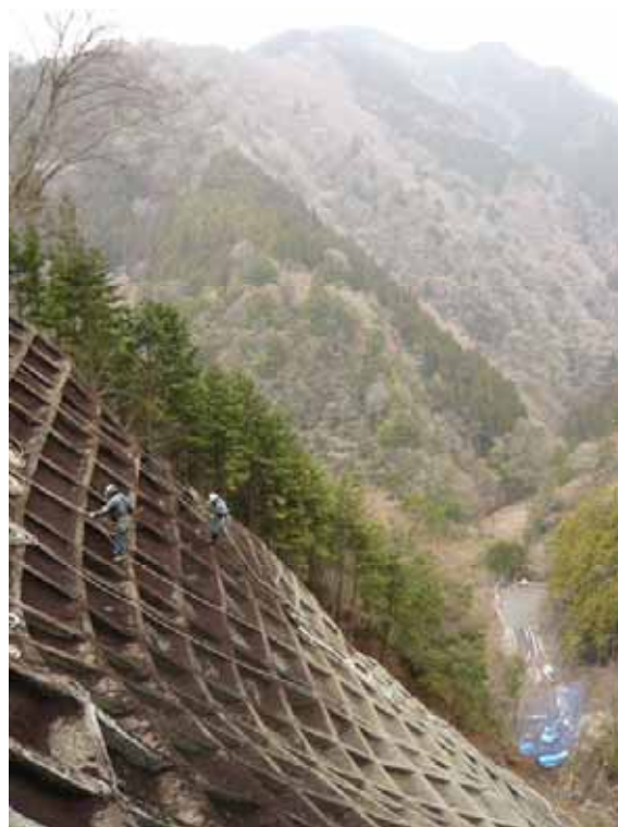
大規模な山腹崩壊地の復旧治山事業

パンフレットやポスター等を市町村に配布し、治山施設の災害防止を果たす役割を PR します。