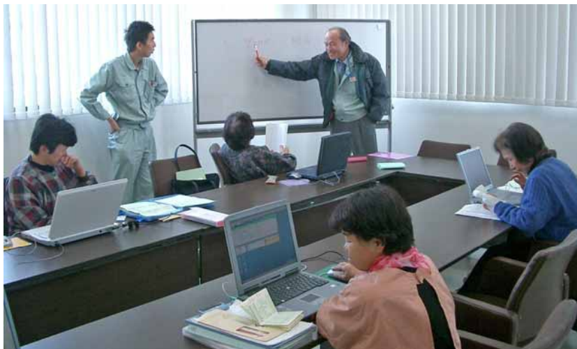
農家の経営改善指導

役割分担や目標設定等の経営管理や家族労力に見合った農業技術指導等により家族経営体を育成します。