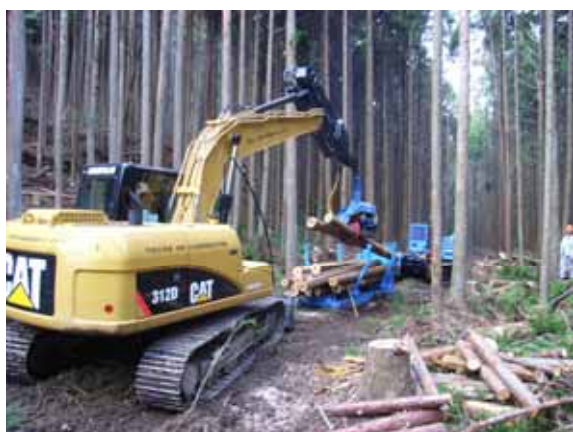
高性能林業機械による 伐倒、玉切り、積込、搬出

当地域は標高差が大きい上、自然が豊かであり、茶臼山、湯谷温泉などを始めとする観光資源にも恵まれています。これらの資源を生かした各種体験イベント等を実施することにより、都市部から多くの人に農山村部を訪れてもらい、豊かな自然、歴史、文化等、農山村の魅力にふれてもらえる環境づくりを行うことで農林水産の振興ひいては地域の活性化を図っていくことが重要です。