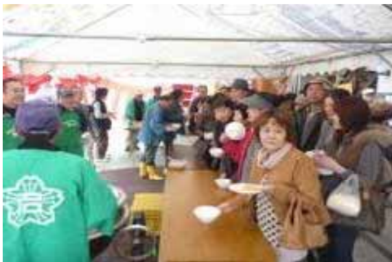
農産物直売所 「アグリステーションなぐら」の 「あぐり感謝祭」

ぶどうのワーキングホリデー、柿のオーナー制度の取組支援により交流活動を推進します。