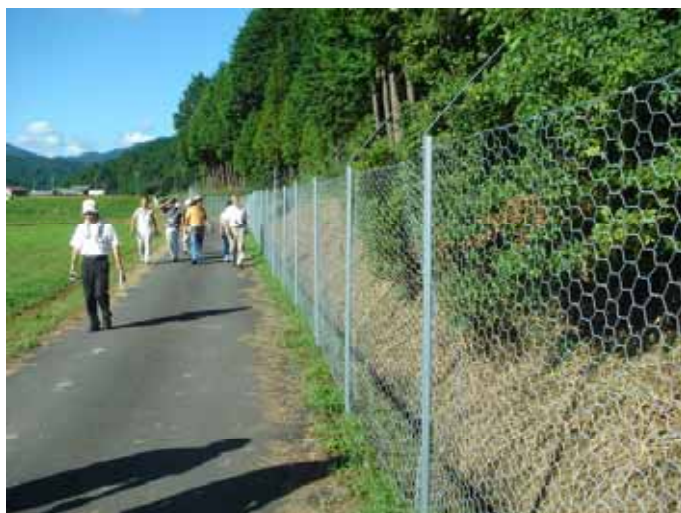
先進地の棲み分け柵設置の様子（三重県）

獣による農作物の被害面積、被害額の削減のために、集落を対象とした研修会の開催、モンキードッグの取組、わなを活用したニホンジカ等の捕獲、サルの接近警戒態勢の整備及び集落環境の整備等を推進します。