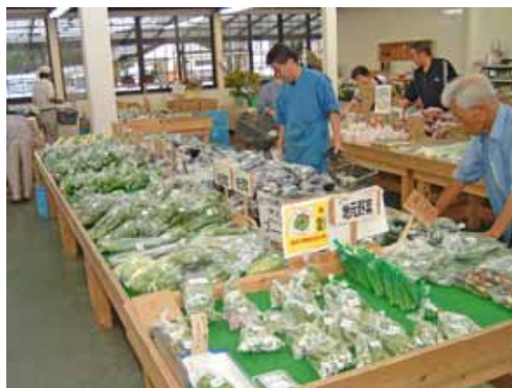
生産者の顔が見える産地直売所