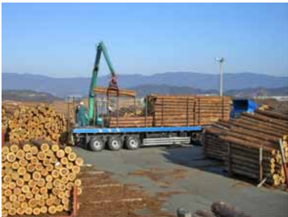
大型トラックによる工場への直送

川上（林業の現場）と川下（木材産業）とが連携して、住宅メーカー等のニーズに応じた木材の安定供給を行う取組を支援するなど産地～加工～供給の効率的な木材流通システムの構築に取り組みます。