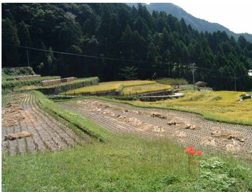
新城市 四谷千枚田

COP10 を契機とした生物多様性に対する県民意識の高まりを活かし、多面的機能を持つ農地等の重要性について広く啓発することにより、ため池や用排水路などの農業用施設等における県民参加型の生物多様性保全などの環境保全活動を支援します。