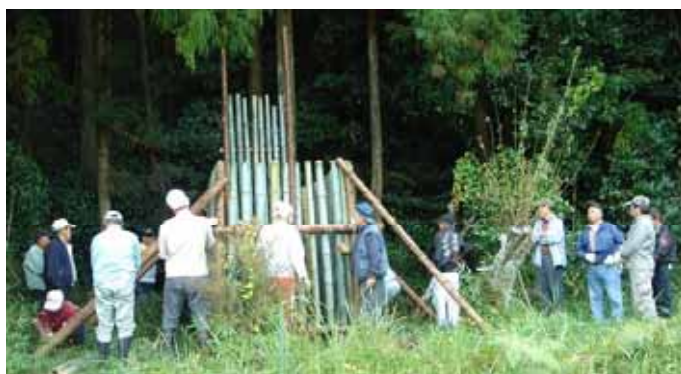
竹による檻の設置（新城市）