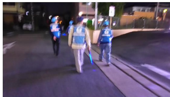
パトロールの様子

月に1回、学区内のコミュニティセンターと集会場の2か所に25人程度が集合して、セーフティパトロールを実施。