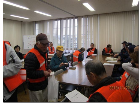
「要支援者救援訓練」での啓発