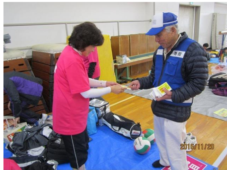
「女子レクバレー」での啓発