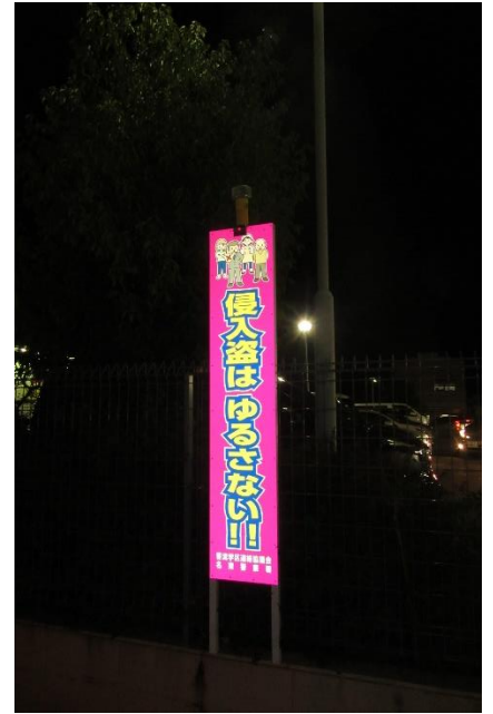
蛍光立て看板設置状況