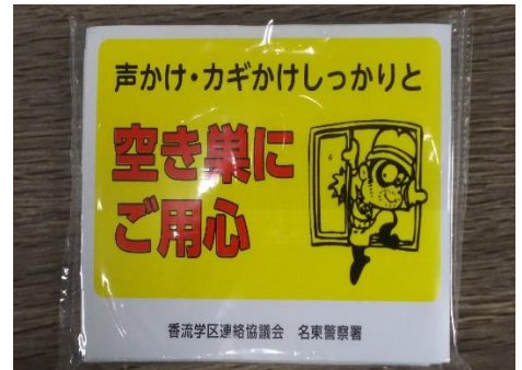
配布したポケットティッシュ