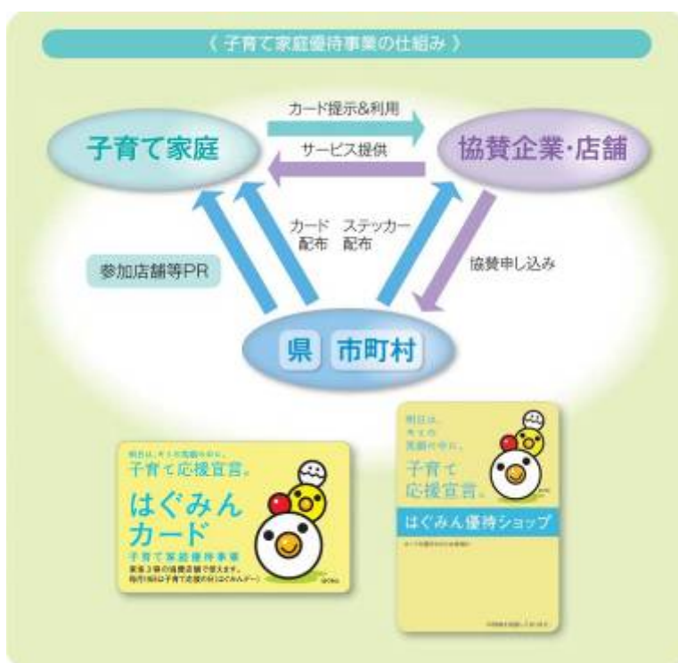
子育て家庭優待制度の仕組み