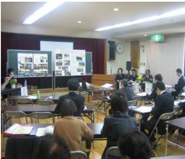
集落支援員を考える講演会及び活動実績報告会