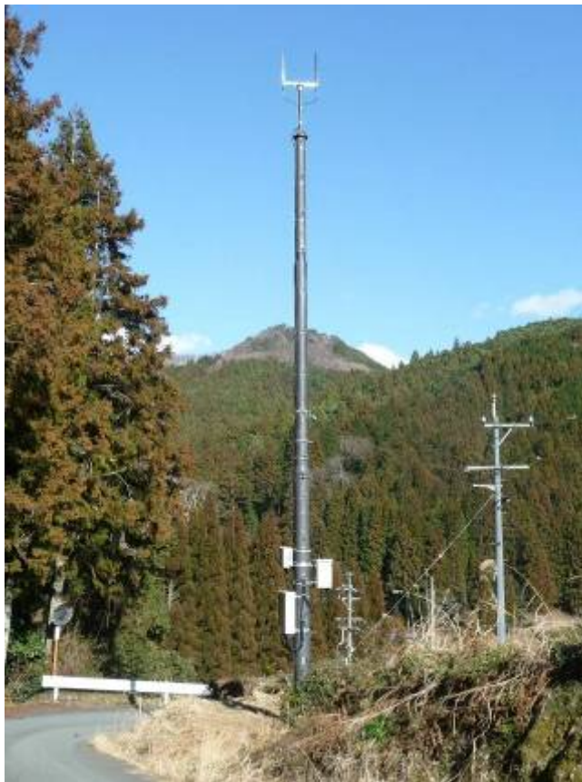
新設された携帯電話基地局（新城市下木和田地区）