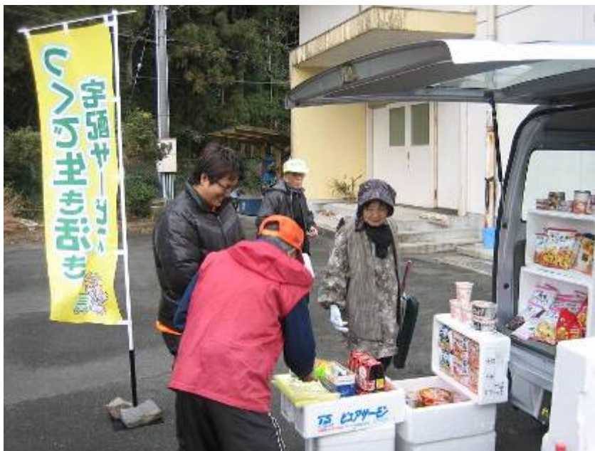
“生き生き号”による宅配サービス（新城市作手地区）