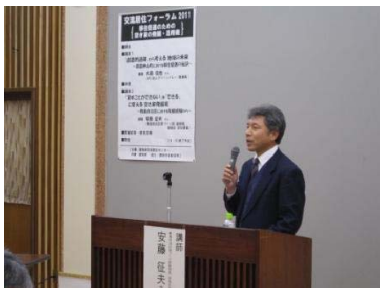
交流居住フォーラム (豊田市足助地区)