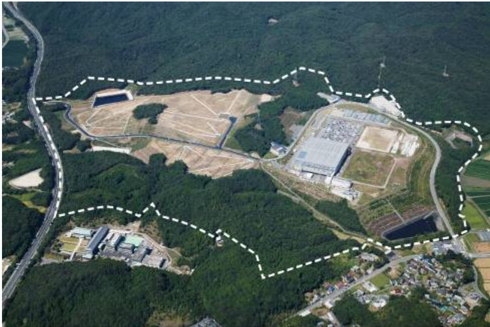
岡崎東部工業団地