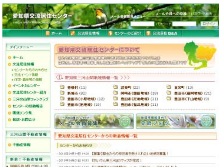
愛知県交流居住センターのホームページ