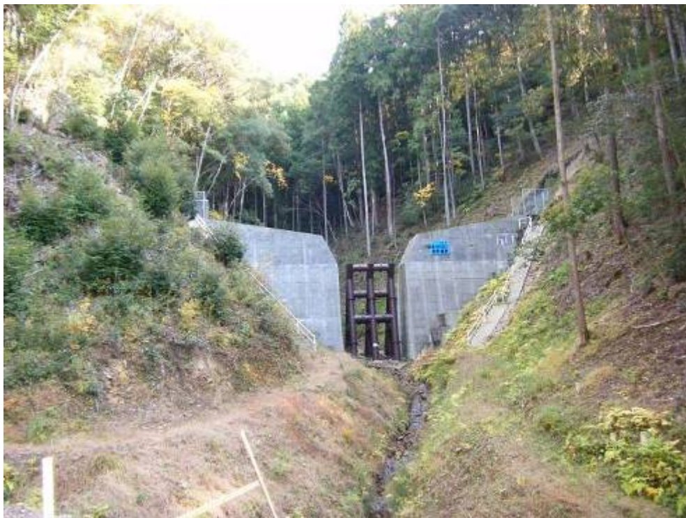
新たに整備された堰堤（豊川水系；新城市只持）