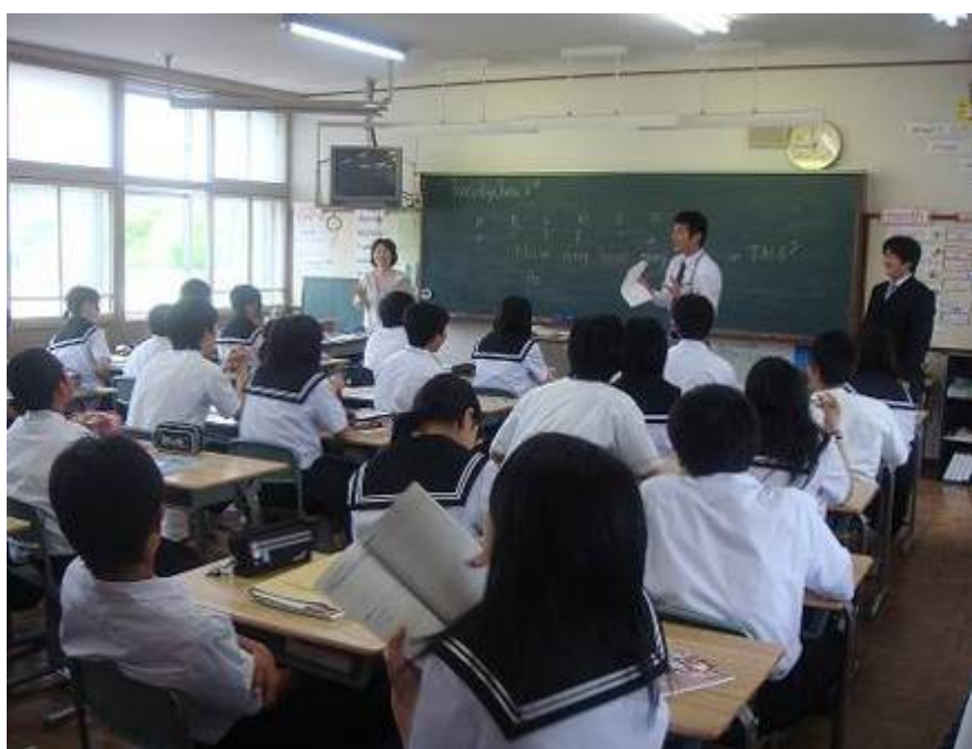
連携型中高一貫教育の様子 (上；連携授業の実施風景 下；トマトの収穫体験)