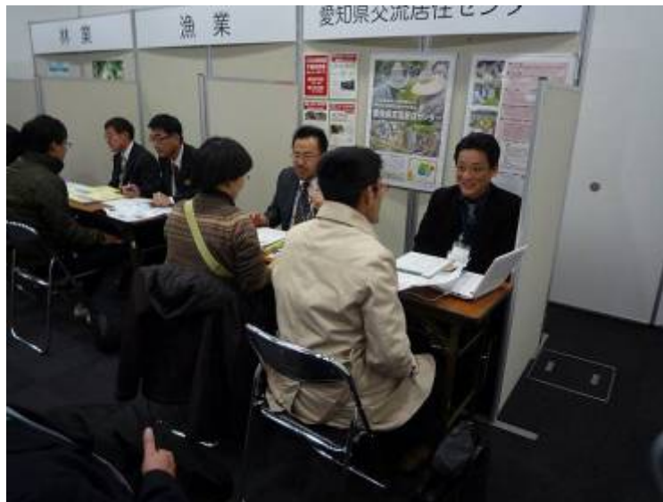
農林漁業就業相談会での移住促進相談