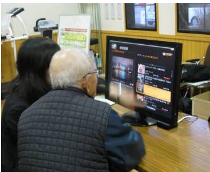
新たな生活支援サービス体験講座