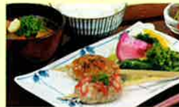
瀬戸豚つくね定食