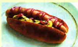
特製米粉パン ホットドック