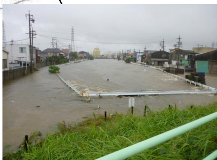
地蔵川の浸水状況(春日井市) 【平成23年9月台風15号時】