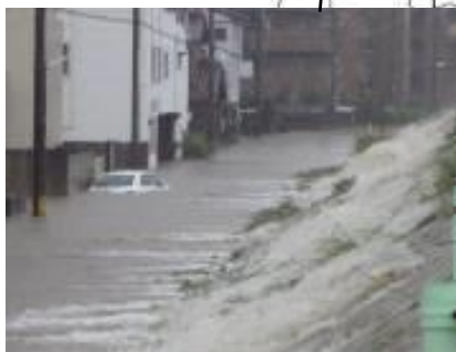
八田川の浸水状況(春日井市) 【平成23年9月台風15号時】