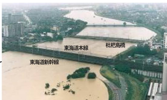
JR東海道新幹線庄内川橋りょう付近 【平成12年東海豪雨時】(名古屋市西区・清須市)