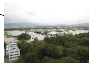
豊川の浸水状況(豊橋市) 【平成23年9月台風15号時】