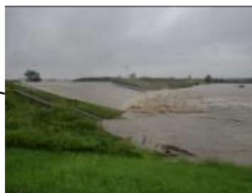
激甚事後初めて越水する洗堰(名古屋市北区) 【平成23年9月台風15号時】