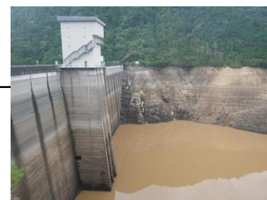
宇連ダムの渇水状況(新城市) 【平成25年9月 貯水率0.8%】