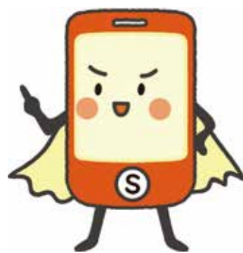
スマホ界のおたすけヒーロー スマ蔵(すまぞう)

スマートフォンは、うまく使いこなせばとても便利なコミュニケーションツールです。ネットを介したコミュニケーションでも、対面でのコミュニケーションと同じようにモラルとマナーを守ることが大切です。スマートフォンに潜む危険性や、その使い方によっては子どもが加害者にも被害者にもなり得ることを十分理解させ、楽しく安全にスマートフォンを使いましょう。