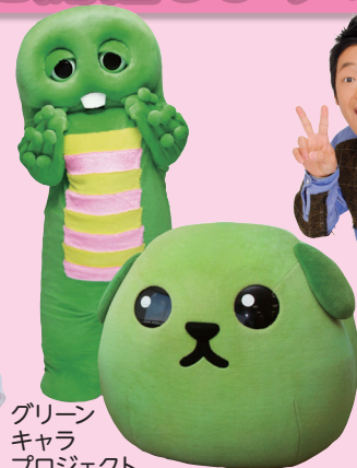
グリーン キャラ プロジェクト ガチャピン&豆しば