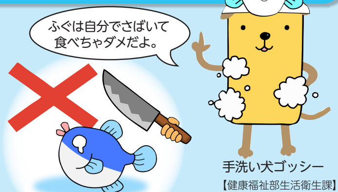
手洗い犬ゴッシー

※愛知県ではふぐ処理師試験を行って、ふぐの専門的な知識・技能を持つ人にふぐ処理師免許を交付しています。