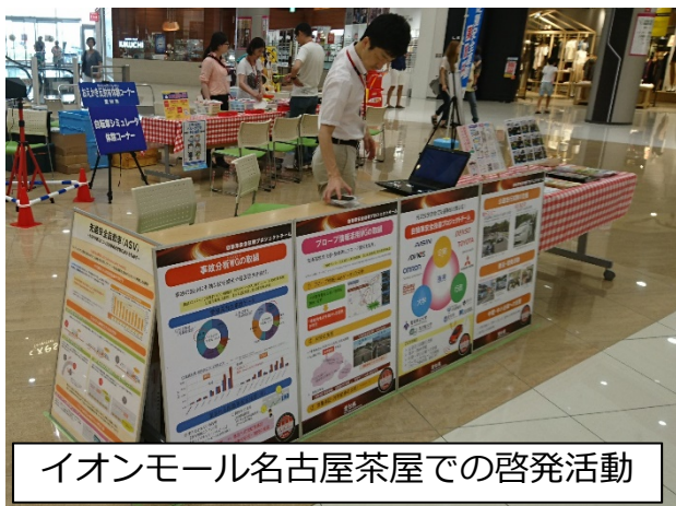
イオンモール名古屋茶屋での啓発活動