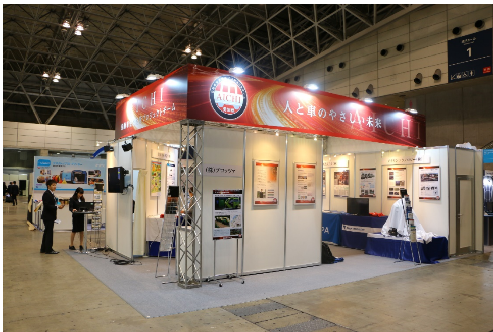
写真は昨年度同事業（CEATEC JAPAN）の様子

「AUTOMOTIVE WORLD」：自動車の電子化・電動化、IT化、軽量化、部品加工などをテーマとした6つの展示会で構成され、自動車業界における重要テーマの最新技術が一堂に集結するアジア最大級の自動車の先端技術展。