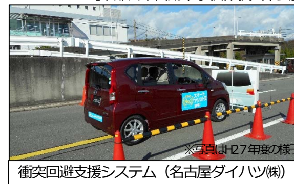
衝突回避支援システム（名古屋ダイハツ(株)） ※写真は27年度の様子