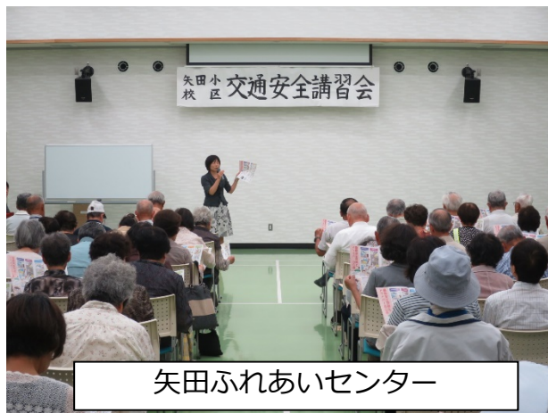
矢田ふれあいセンター