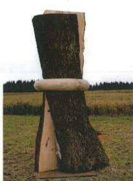
U N I T Y 300 × 140 × 120 cm 樫木 国際彫刻シンポジウム、2011年 マルクノイキルヘン、ザクセン州、ドイツ