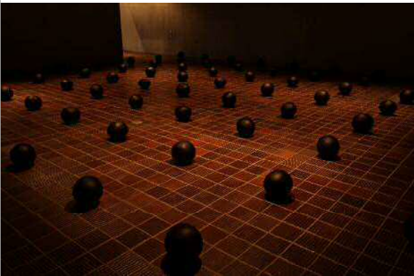
愛知県立芸術大学退任記念展