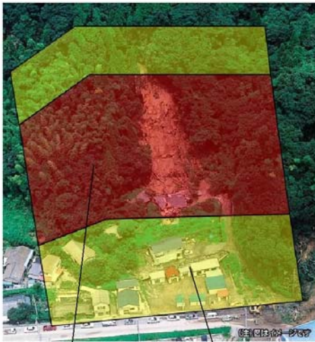
土砂災害特別警戒区域の範囲