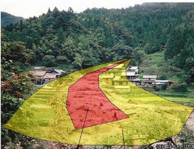
土砂災害特別警戒区域の範囲