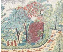
山下清「庭」1936年 (おかざき世界子ども美術博物館所蔵)