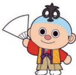
からくりロボットの“ブンゾー”

愛知県の文化事業のマスコット「からくりロボットの“ブンゾー”」をマスコットキャラクターとして活用し、「第31回国民文化祭・あいち2016」と連携を図りながら、「第16回全国障害者芸術・文化祭あいち大会」の開催気運の醸成と参加意欲の喚起を図ります。