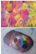
岡部志士 絵画:「夏のコンポジション」2012年 立体:「コロイチ」2014年

1982年生まれ。滋賀県在住。2008年に作品がスイスの「アール・ブリュット・コレクション」に収蔵されている。2010年「ART BRUT JAPONAIS」(パリ・アルサンピエール美術館)出展。2012年「アール・ブリュット・ジャポネ」(高浜市やきもの里かわら美術館)出展。その他多くの展覧会で取り上げられる。2013年「第55回ヴェネチア・ビエンナーレ」出展、2014年「ボーダレス・アート・コレクションー芸術がほどいてゆく境界ー」(高浜市やきもの里かわら美術館)