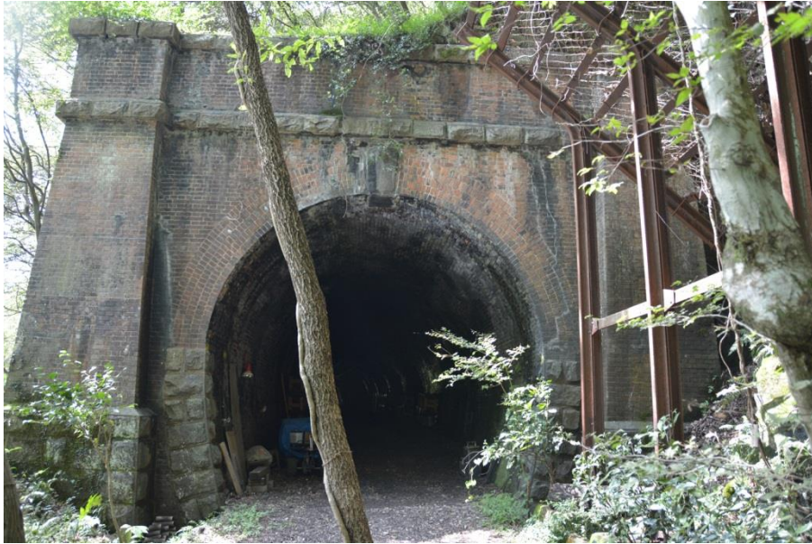
旧中央線玉野第三隧道 東坑門正面外観