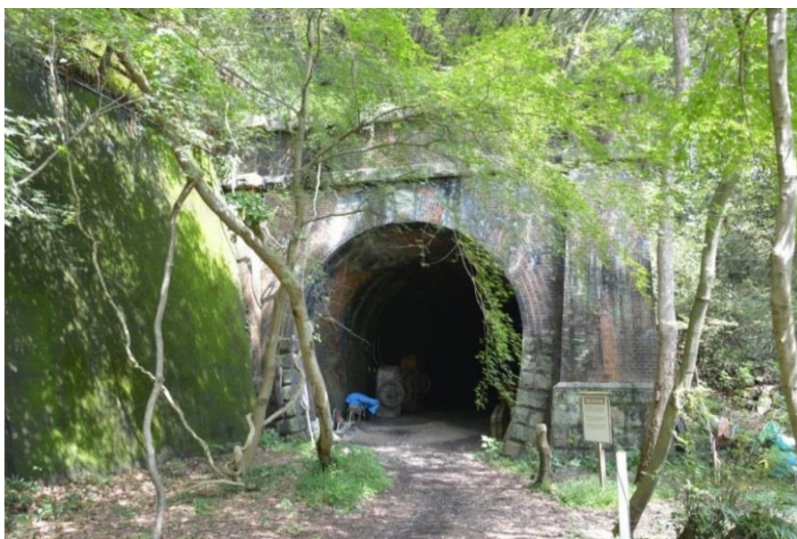
旧中央線玉野第三隧道 西坑門正面外観