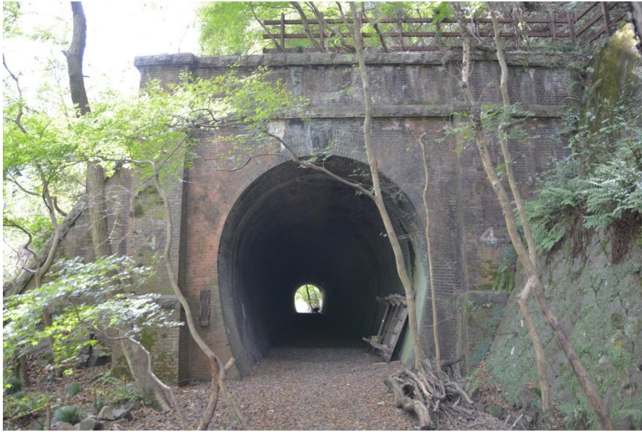
旧中央線玉野第四隧道 東坑門正面外観