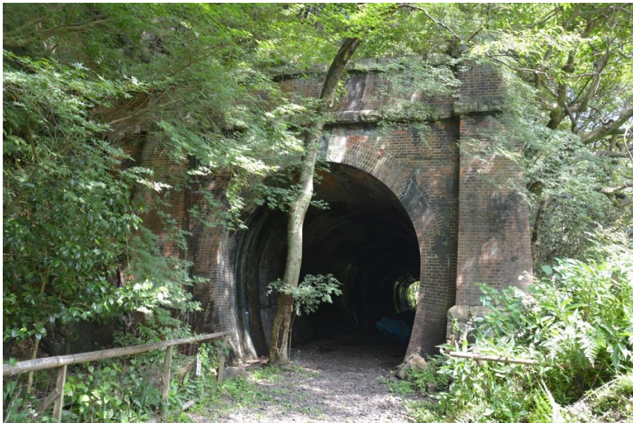
旧中央線玉野第四隧道 西坑門正面外観