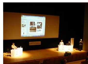
（トークイベント） アートと福祉のあいだ