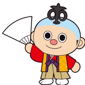
からくりロボットの “ブンゾー”

愛知県の文化事業のマスコット「からくりロボットの“ブンゾー”」をマスコットキャラクターとして活用し、「第 31 回国民文化祭・あいち 2016」と連携を図りながら、「第 16 回全国障害者芸術・文化祭あいち大会」の開催気運の醸成と参加意欲の喚起を図ります。