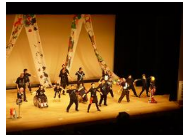
（パフォーマンス） ウゴクカラダ