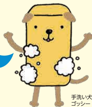
手洗い犬 ゴッシー