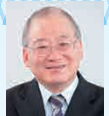
淑徳大学 北野大 教授

農薬や食品添加物などの化学物質の必要性、安全性について理解を深めていただくために、淑徳大学北野大教授を招いてセミナーを開催します。