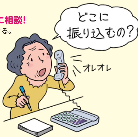
【県民生活部地域安全課】