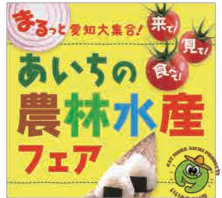
【農林水産部食育推進課】

「あいちの農林水産フェア」及び「いいともあいち運動」の情報はこちら http://www.pref.aichi.jp/shokuiku/iitomo/