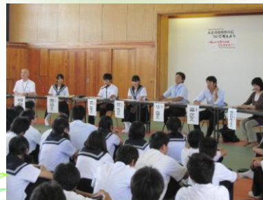
美浜町立野間中学校

いろいろな考えを聞いてみよう！ おうちの人や地域の人、先生や 友だちの考えを聞いて、自分も 考えたり意見を言ったりします。 いろいろな人の考えをもとに、 自分もまた、いろいろ考えてみます。