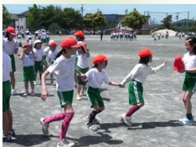
豊田市立四郷小学校

じぶんの成長を感じて 全校を24の縦割り班に分け ます。班ごとに、高学年が考え た遊びをします。