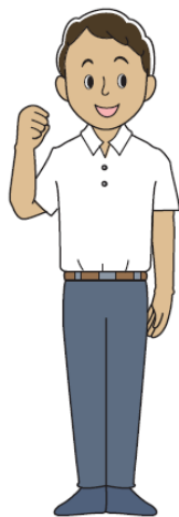
ていん ティンさん