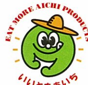
あいちの 農林水産マップ

遠隔地から大量の食料を輸送することは、CO 2 の排出量を増やし、地球の温暖化にもつながっています。地域で生産されたものを地域で消費する地産地消は、輸送に伴うCO 2 の排出も少なく、地球環境に優しい取組です。