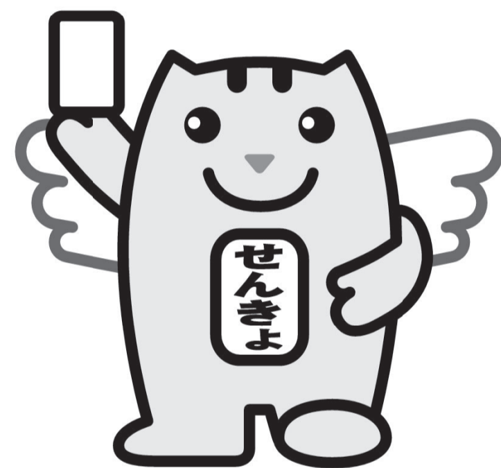
選挙のめいずいくん