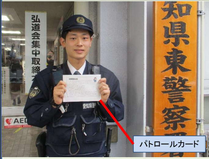
パトロールカード

巡回連絡とは、交番員が皆さんからのご要望等をお伺いしたり、災害や事故の発生時に連絡が取れるよう家族構成や非常時の連絡先等を聴取するため、ご家庭等を訪問するものです。