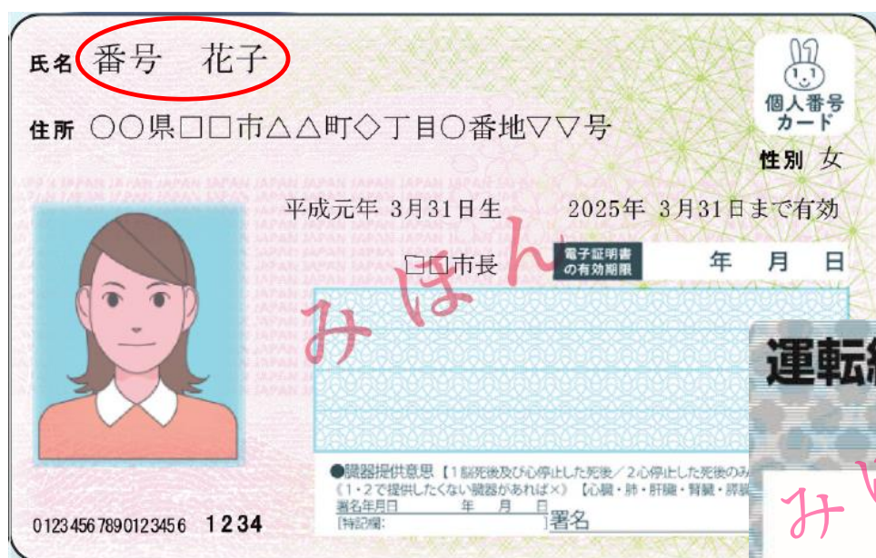
マイナンバーカード