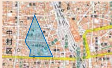
名古屋市 中村区 椿町