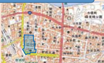
豊橋市松葉 1～2丁目、広小路 1丁目