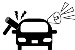
周囲に異常を 知らせる警報装置