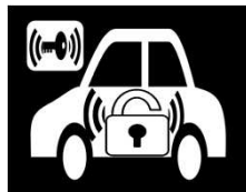
追加のイモビライザー