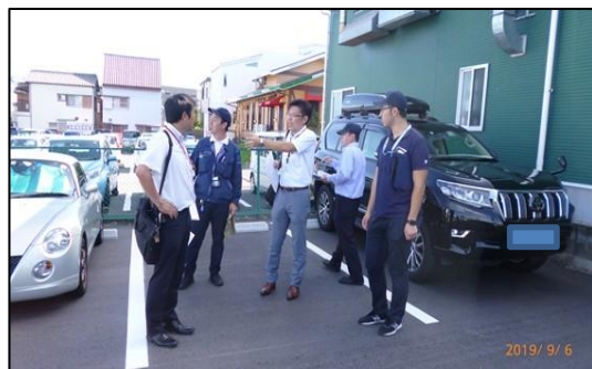
防犯カメラの効果的設置に関し警察官からアドバイスを受ける状況

そのほかにも、会社で青色防犯パトロールを運用し、地域の見守り防犯パトロールも行っています。地域の安心・安全のため、今後も防犯CSR活動を続けていきます！