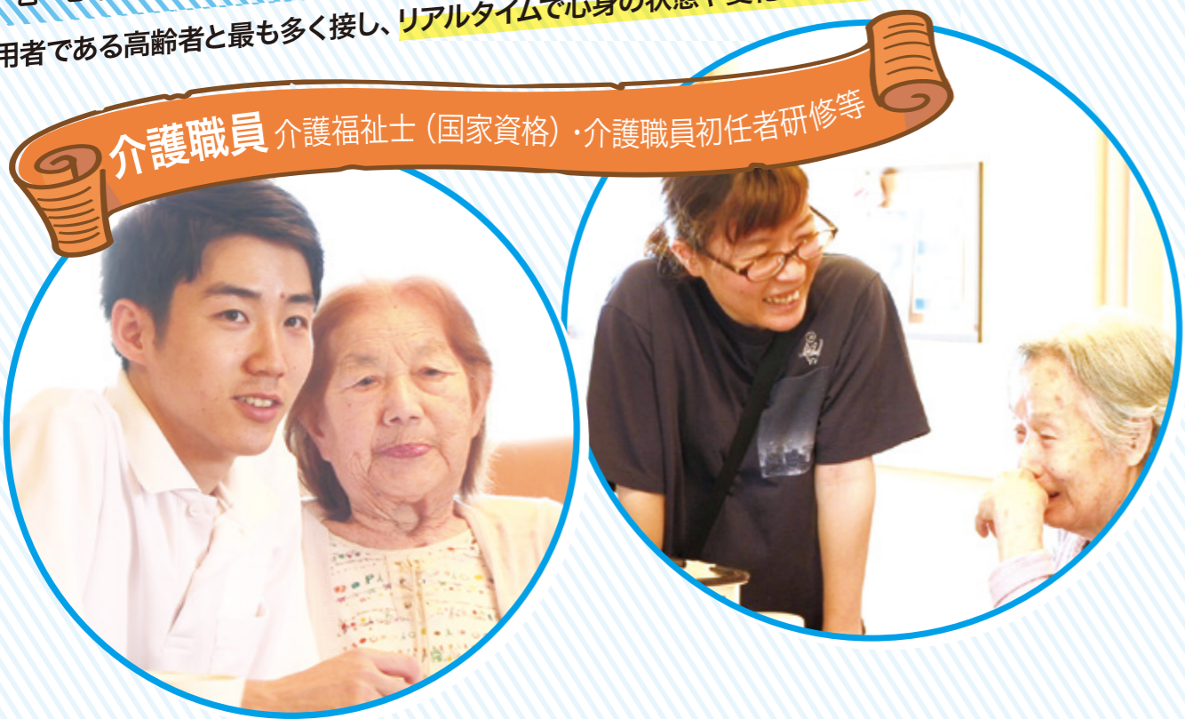
介護職員 介護福祉士(国家資格)・介護職員初任者研修等

利用者である高齢者と最も多く接し、リアルタイムで心身の状態や変化を把握し、理解しているのが介護職員。