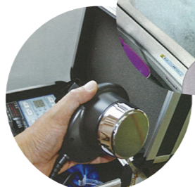
ちょうおんぱ 超音波