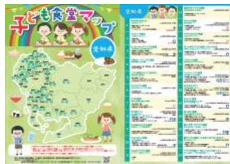
愛知県子ども食堂マップ