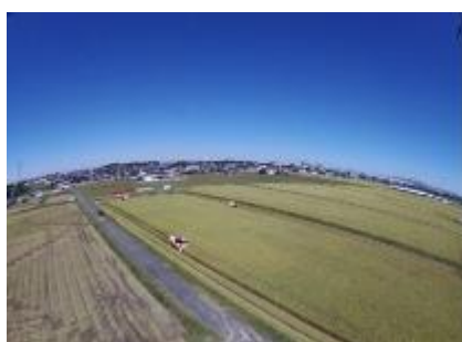
大区画化された農地（豊田市）