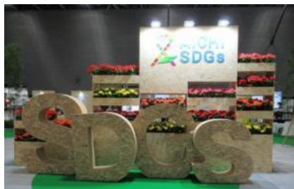
SDGs AICHI EXPO 2023 (愛知県ブース)

また、県民や芸術関係者、NPO、企業、市町村等と連携・協働して愛知から文化芸術を世界へ発信する国際芸術祭「あいち 2025」の開催に向けて準備を進めるとともに、2026 年に開催する第 20 回アジア競技大会・第 5 回アジアパラ競技大会に向けて準備を進めます。