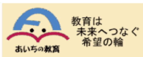
「あいちの教育」シンボルマーク

その他、地域スポーツの活性化に向けて、総合型地域スポーツクラブの運営や指導者確保を支援します。