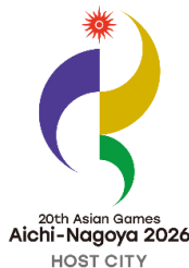
第 20 回アジア競技大会エンブレム