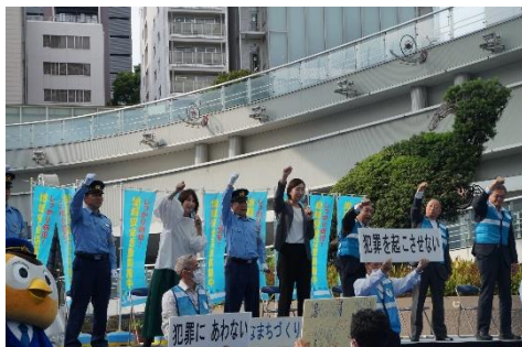
春の安全なまちづくり県民運動

警察活動では、県内各地域にある 45 の警察署を拠点として、犯罪の予防や検挙、交通の安全指導や取締りなど県民の生命や財産を守るための活動をたゆまず行います。SNS 上で実行犯などを募集する闇バイトによる犯罪の発生を防ぐため、SNS 上の違法・有害投稿に対して、返信機能を活用した投稿者への個別警告を自動化するシステムを導入します。