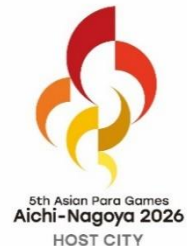
第 5 回アジアパラ競技大会エンブレム