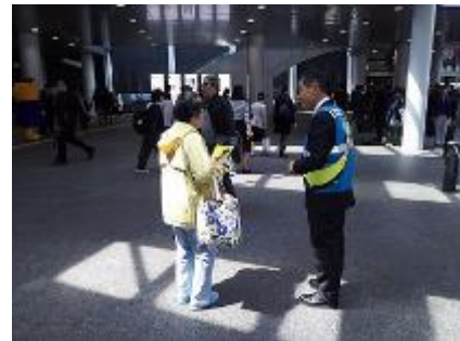
特殊詐欺被害防止啓発活動