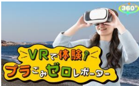
プラスチックごみ問題について学ぶ啓発動画

その他、公共工事でリサイクル資材を多く利用するため、基準を満たす資材をあいくる材として認定する愛知県リサイクル資材評価制度を運用します。