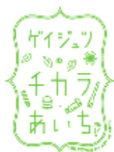
あいちアール・ブリュットのロゴマーク

全ての人の人権が尊重される社会の実現に向けて、人権に関する相談対応を行うとともに、人権課題をテーマとした講演会及びワークショップを実施します。また、愛知県ファミリーシップ宣誓制度の運用・普及啓発を行います。