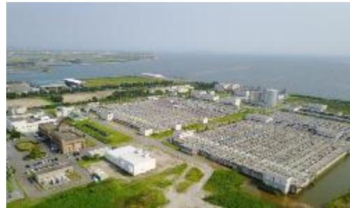
矢作川浄化センター