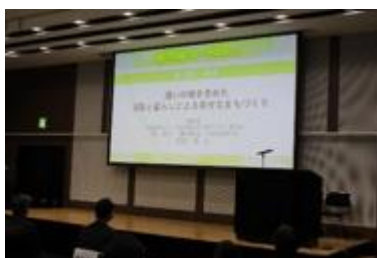
介護予防のための通いの場に関するフォーラム

さらに、がんセンターにおいて、世界に発信できる医療・研究を推進するため、MD アンダーソンがんセンターとの連携により、共同研究や人材交流を行うとともに、シンポジウムを開催します。新型コロナウイルス感染症については、ワクチンの副反応や罹患後の後遺症に関する相談窓口を引き続き設置するとともに、適時適切に必要な対策を実施します。