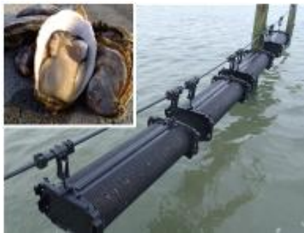
かきのシングルシード式養殖

さらに、生態系を含めた海洋環境の悪化や海岸機能の低下等を引き起こす海洋ごみへの対策として、漂着ごみの組成調査や発生抑制のための普及啓発を実施するとともに、市町村が行う海洋ごみの回収・処理を支援します。