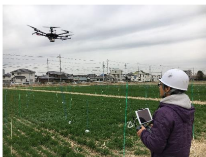
ドローンによる生育診断

その他、畜産業の自給飼料の生産・利用拡大の推進や、就農希望者・新規就農者への支援を行うなど、担い手育成にも取り組みます。