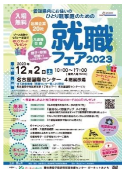
ひとり親家庭のための就職フェア

さらに、子どもの貧困対策として、児童養護施設等で生活する児童への大学進学等に要する費用の支給や子ども食堂の開設等の支援、学習支援や居場所の提供に取り組みます。