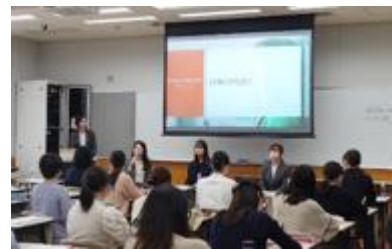
女子大学生と女性活躍推進企業との交流会