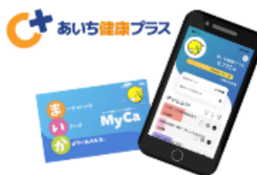
あいち健康マイレージ連携アプリ 「あいち健康プラス」