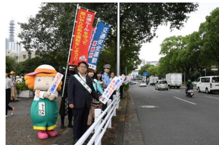
交通安全県民運動