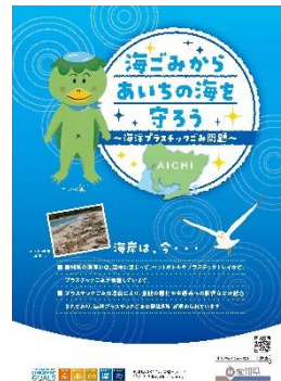
海洋ごみ発生抑制普及啓発リーフレット