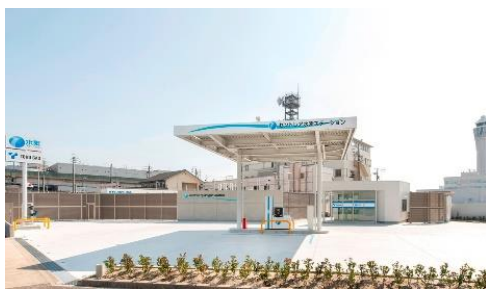
水素ステーション

その他、住宅用地球温暖化対策設備の導入補助制度により、太陽光発電施設や住宅の断熱性能等を高める設備等の導入を支援するとともに、次世代バッテリーの研究・実証、人材育成、製造拠点等集積化に向けたプロジェクトを推進します。