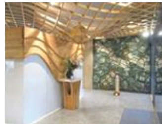
愛知県公館エントランスの木質化