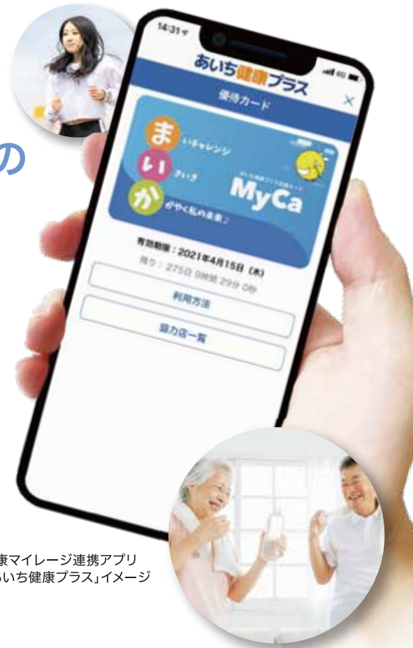
※健康マイレージ連携アプリ「あいち健康プラス」イメージ